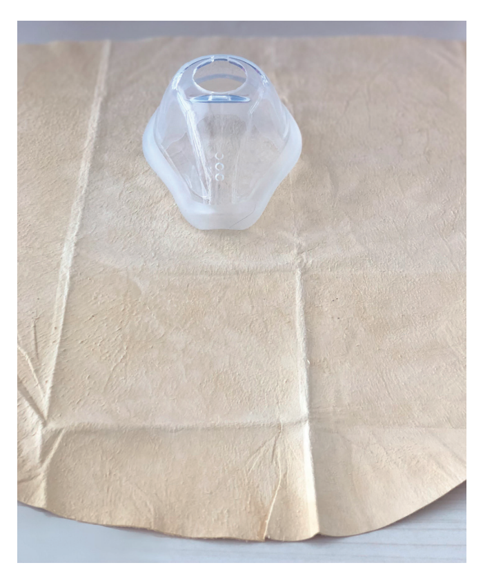
SCHRITT 2: Skizzieren Sie auf dem Leder großzügig die Umrisse Ihres Maskenkissens (außerhalb und innerhalb!)

SCHRITT 1: Breiten Sie das Ledertuch auf einem Tisch aus und legen Sie Ihre Maske mit der offenen Seite des Maskenkissens darauf.